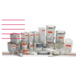
Valspar Industrial Line