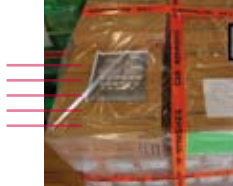
Extra controle orders