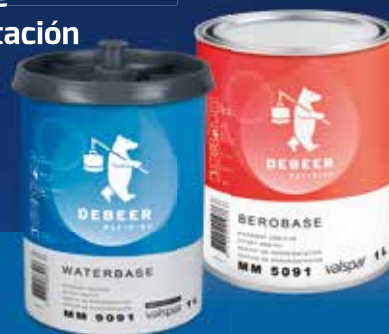
WaterBase Serie 900+